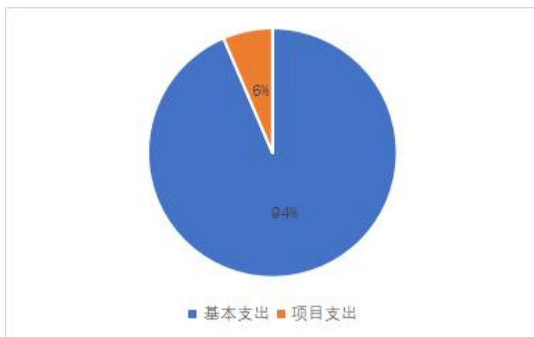
图一：支出构成情况（按支出性质）

本部门 2019 年度本年支出合计 63.02 万元，其中：基本支出 58.9725 万元，占 94%；项目支出 4.0475 万元，占 6%；经营支出 0 万元，占 0%。