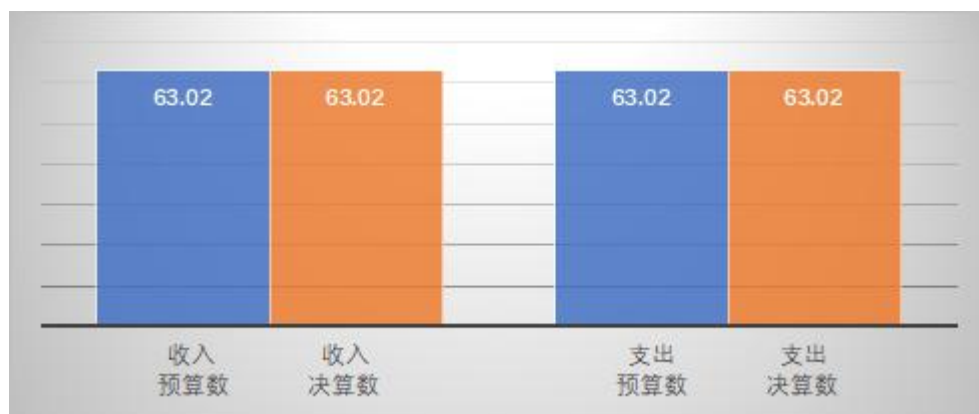
图三：财政拨款收支预决算对比情况